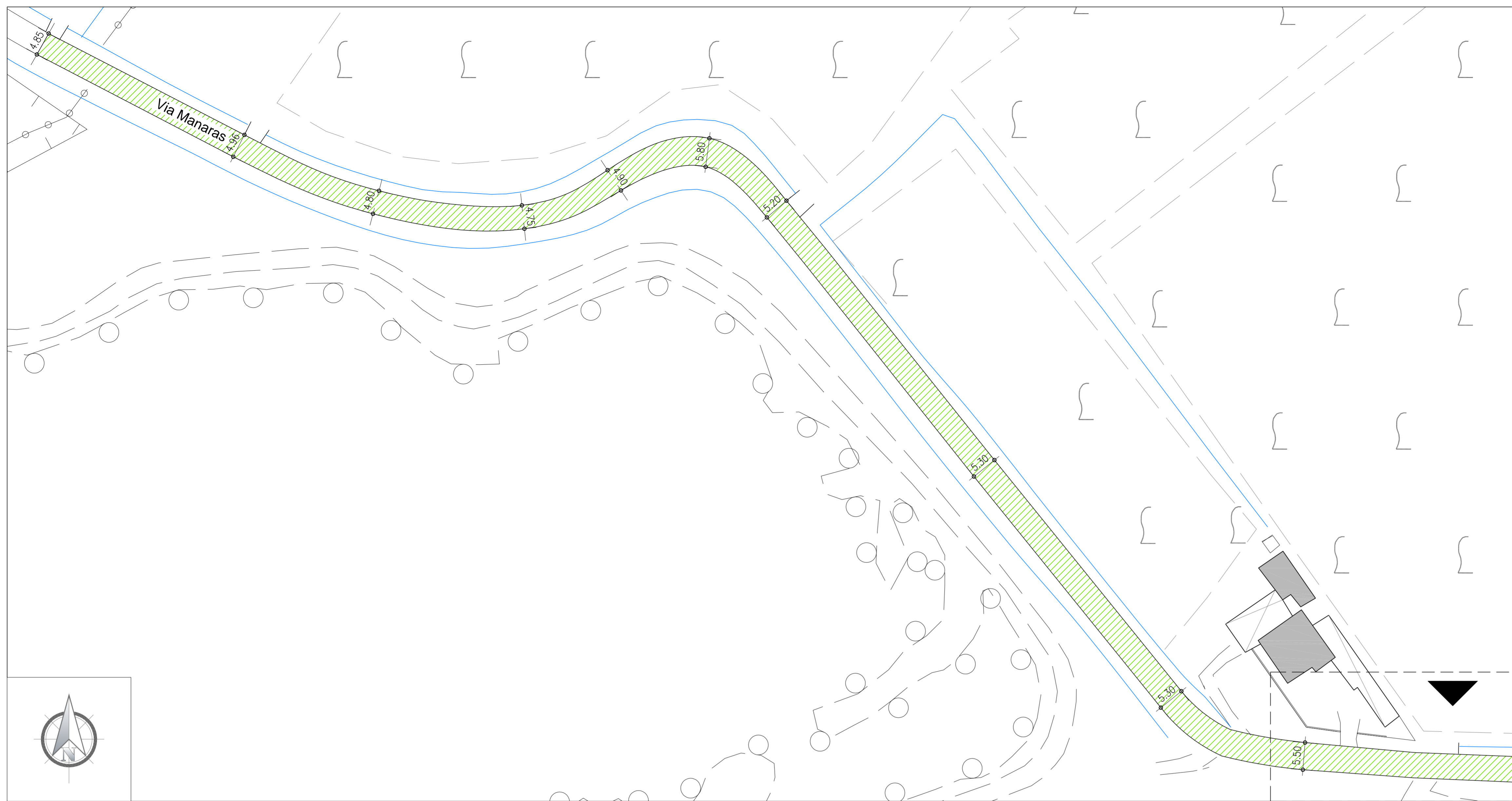
Via Manaras - tratto Ovest, Scala 1:500