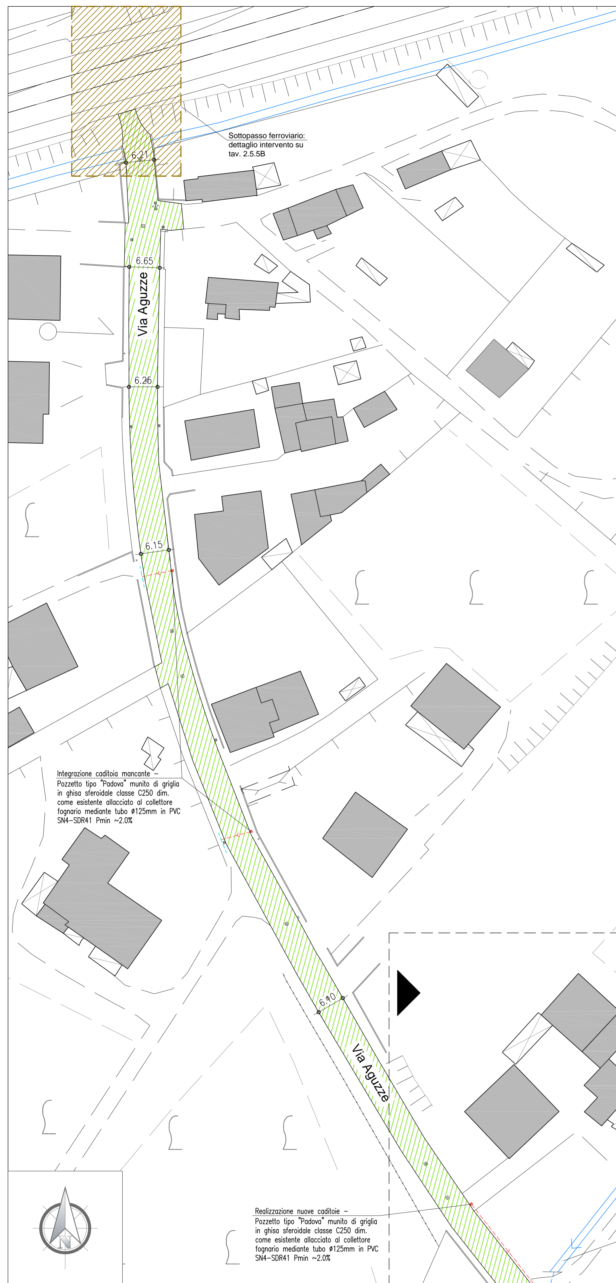
Via Aguzze - tratto Nord, Scala 1:500