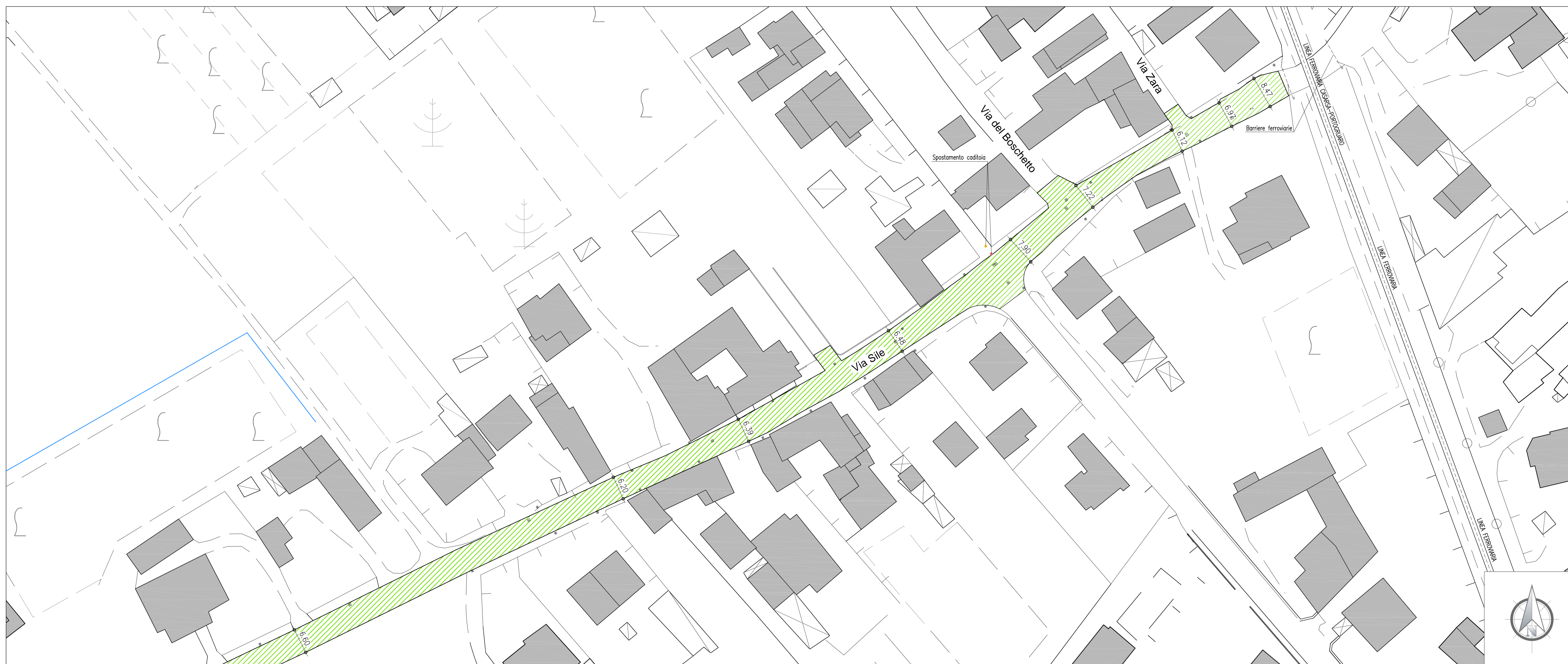
Via Sile (Quadro D), Scala 1:500