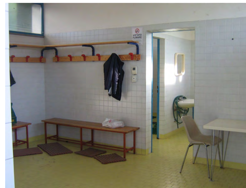
Foto interno spogliatoio